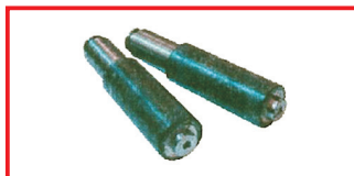
Artt. EP45PL - EP25-0005-00